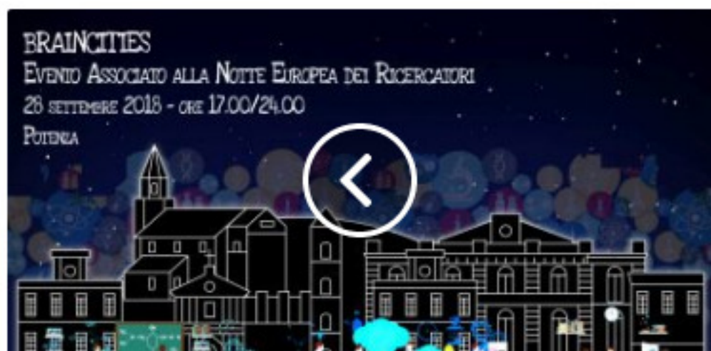
NOTTE RICERCATORI: A POTENZA PROGETTO "BRAINCITIES"